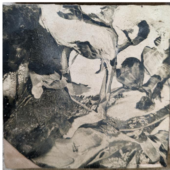
Détails Monotype à l'encre - carreau d'argile 10x10