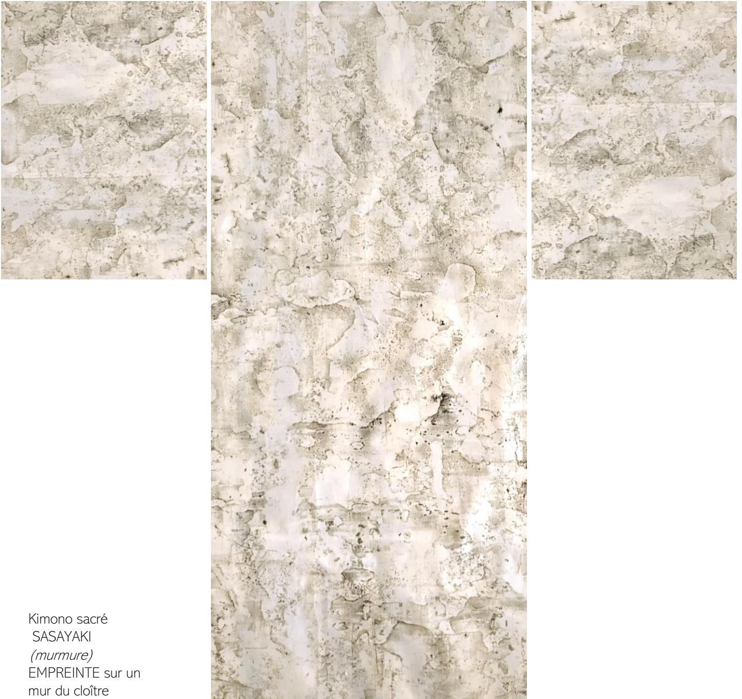
Kimono sacré SASAYAKI ( murmure ) EMPREINTE sur un mur du cloître Encre sur toile de coton 160x140

Ce kimono de mémoire a été réalisé à partir d'empreintes à l'encre effectuées sur un des murs du cloître de l'abbaye, sur une partie bleuie par le bleu de méthylène utilisé au cours de la guerre 14-18.