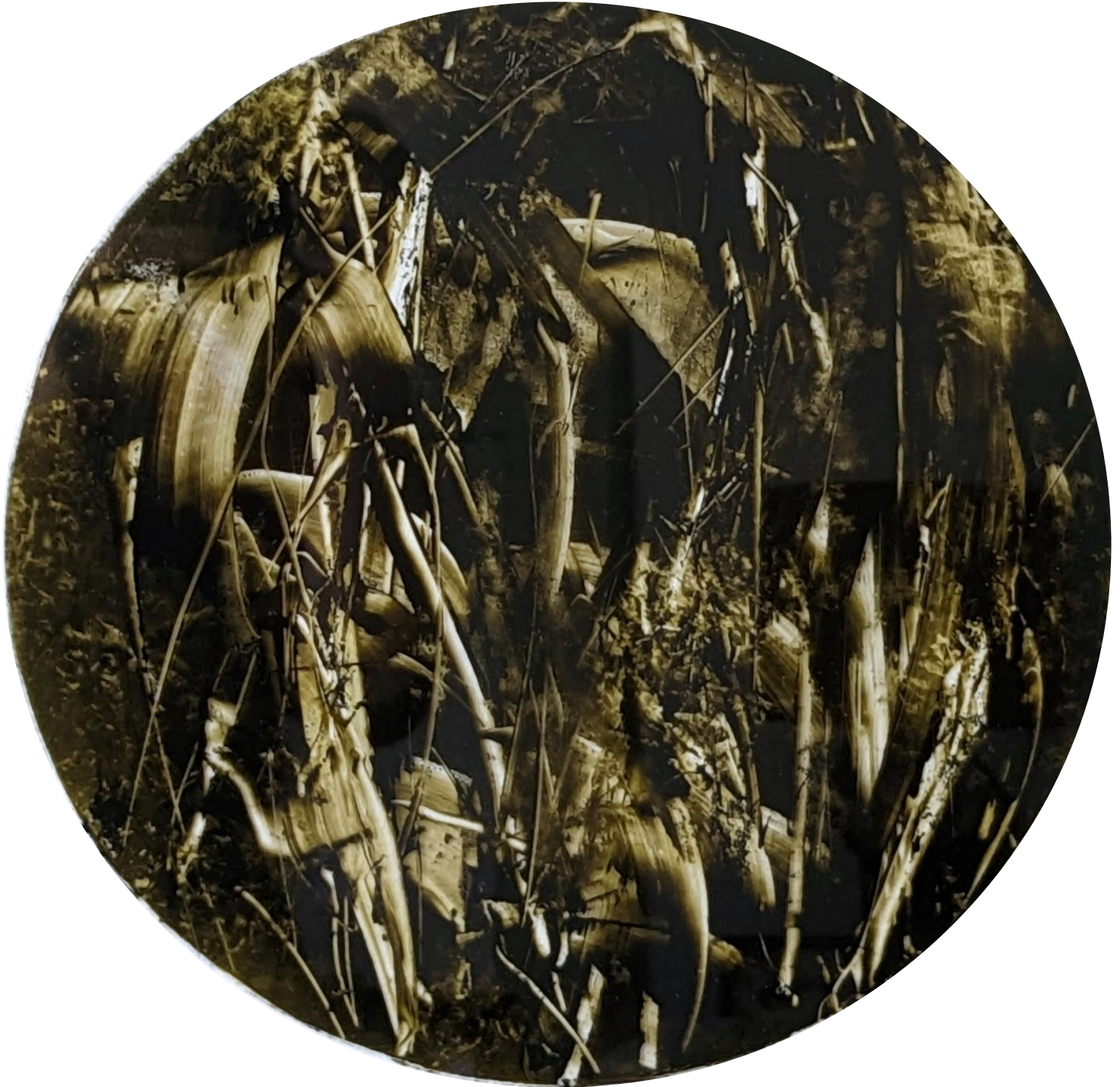
Monotype à l'encre sur verre 40x40 .