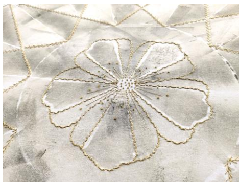
Détail : Fleur de cerisier en broderie – emblème du jardin de Valloires

Eclosion dans le marbre : empreinte de l'œuvre en marbre du baron Pfaff de Pfaffenhoffen (XVIII). Sol / Marche-pied de l'Autel de la chapelle de l'Abbaye sous lequel reposent ses fondateurs.