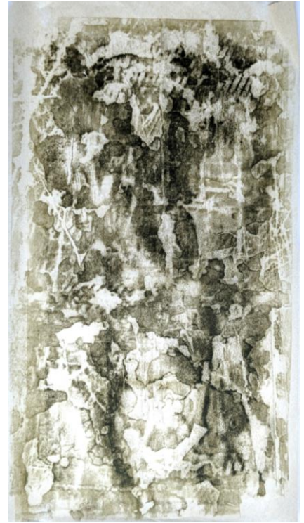
3 (/25) empreintes réalisées à l'encre sur papier wenzhou sur les piliers du cloître de l'Abbaye de Valloires, 45x25.

Dans le cloître détruit puis reconstruit, espace central « sacré » de l'abbaye, espace de prière et de méditation, j'ai cherché à faire apparaître des images, des langages, des rêveries, inscrits dans la pierre, principalement par les enfants hébergés et accompagnés à Valloires depuis un siècle.