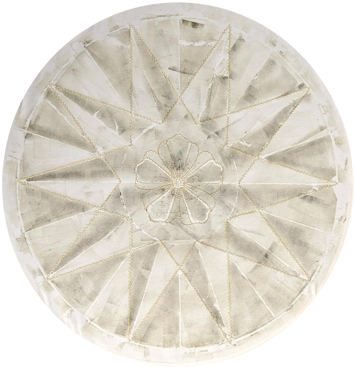
Empreinte à l'encre sur toile de coton, rehaussée par une broderie au fil d'or, 100x100