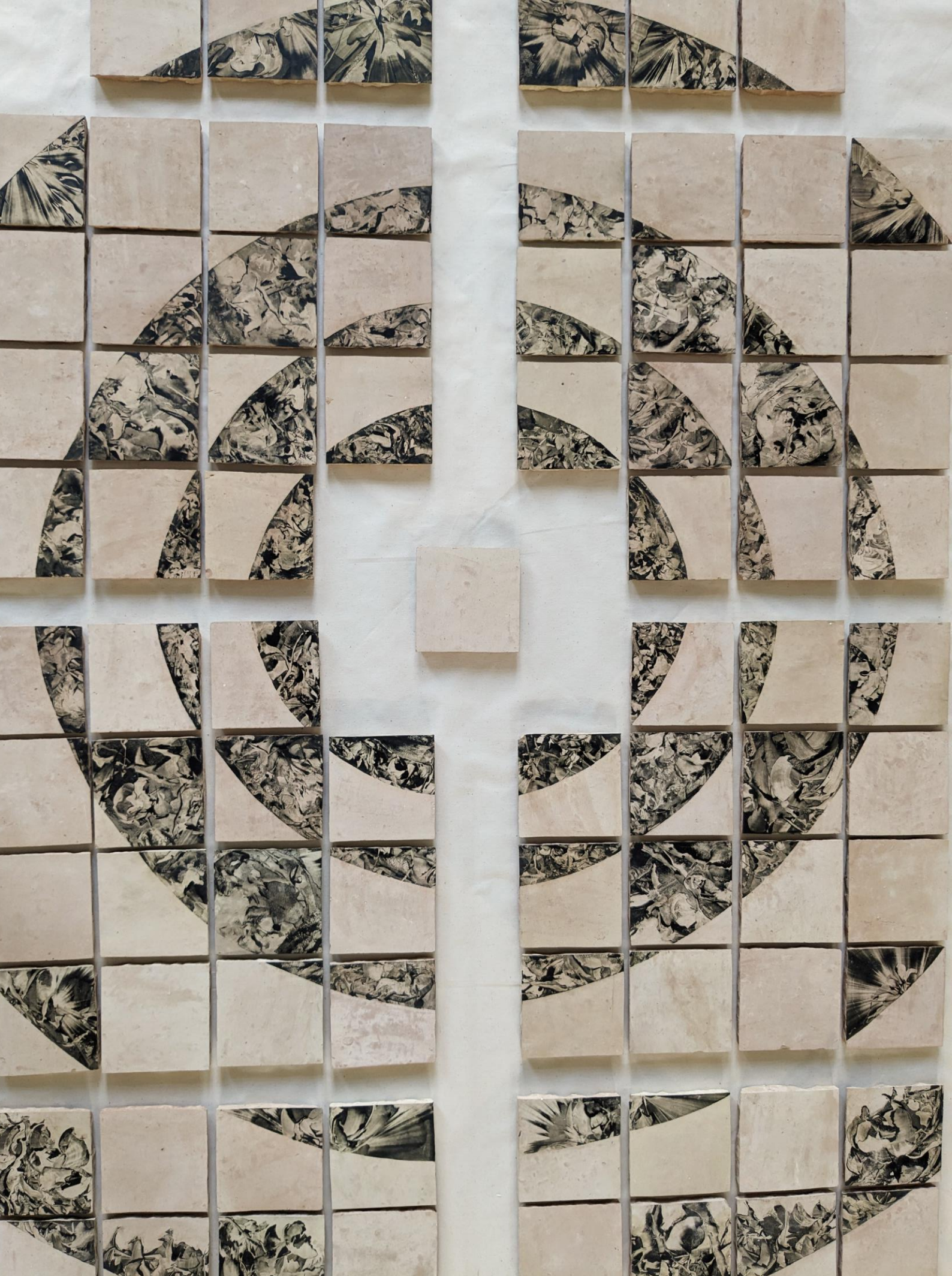
Détail du monotype Rayonnement du Choeur 150 x 150