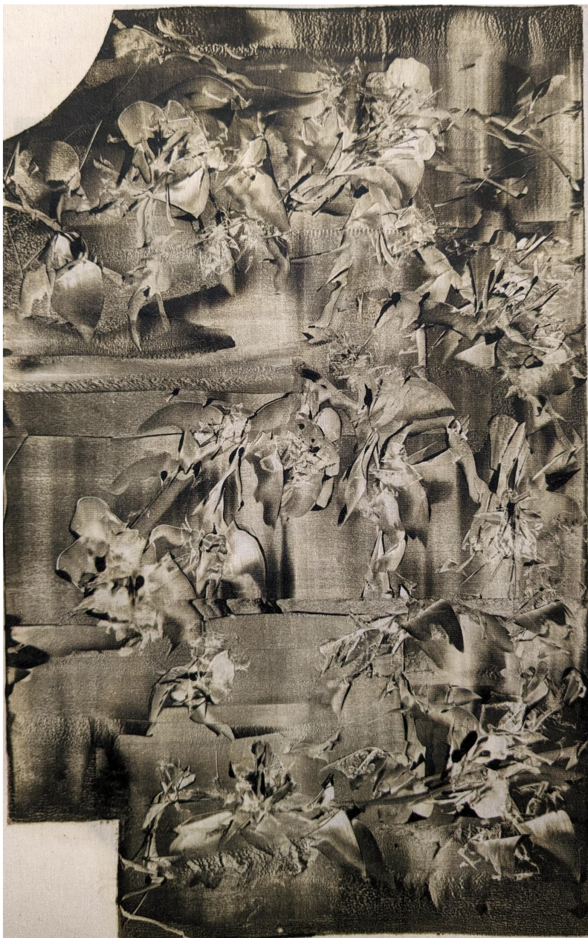
Kimono sacré MIZU (détail manche du kimono)