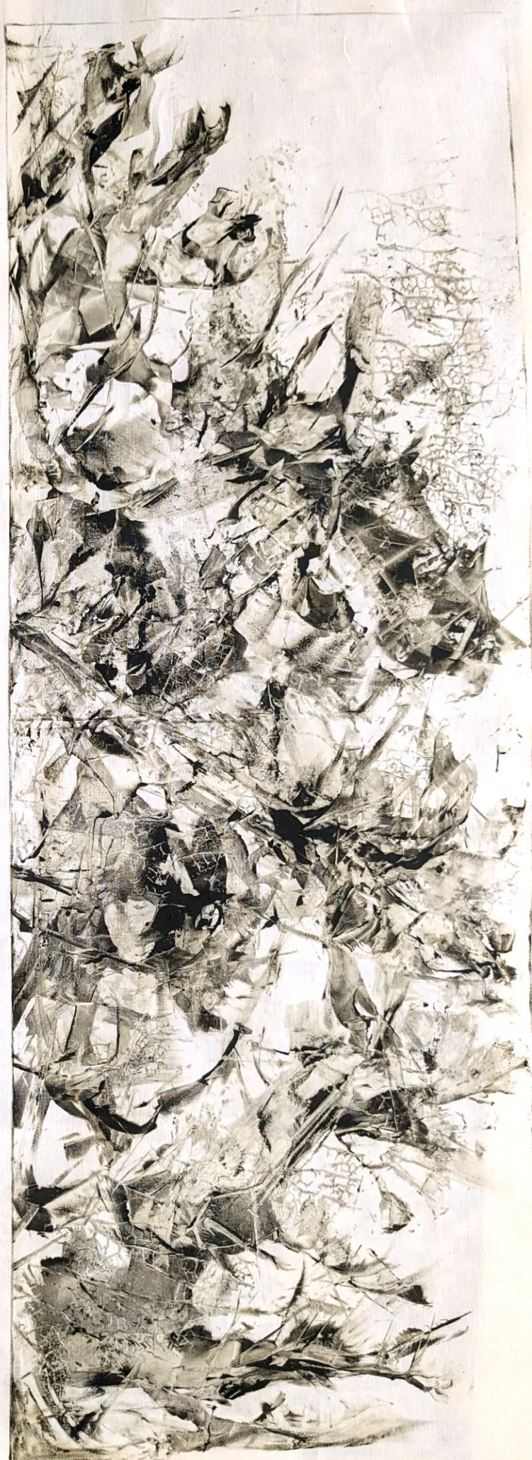
MONOTYPE à l'encre sur toile de coton 120x70